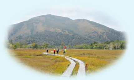
同左 尾瀬・至仏山