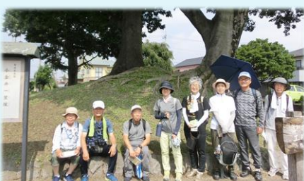
8月 小金井の一里塚