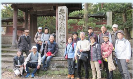
12月 鎌倉十三仏巡り・寿福寺