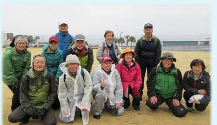
2月 浦賀水道をバックに