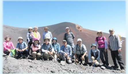
9月 富士山・宝永火口縁