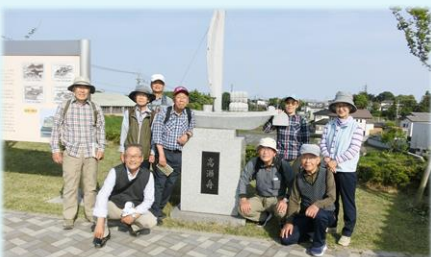
5月 間々田宿-乙女河岸